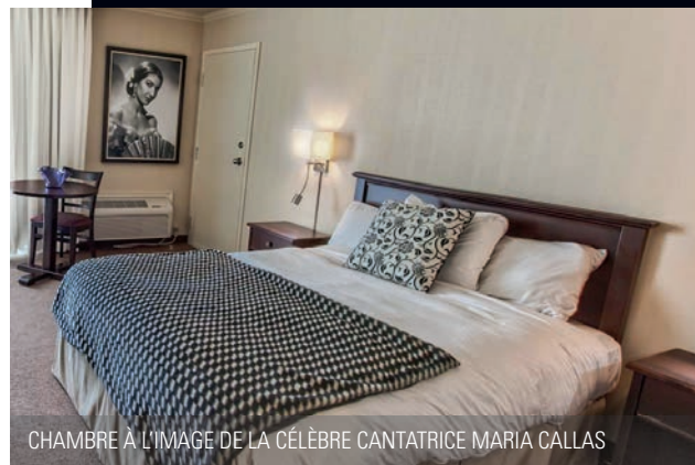
CHAMBRE À L'IMAGE DE LA CÉLÈBRE CANTATRICE MARIA CALLAS