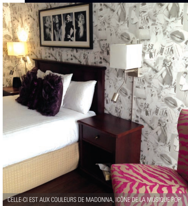
CELLE-CI EST AUX COULEURS DE MADONNA, ICÔNE DE LA MUSIQUE POP