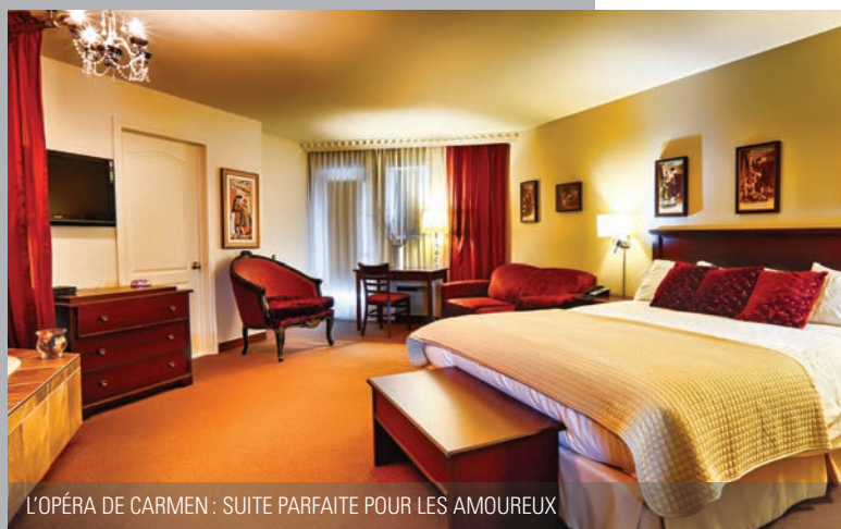
L'OPÉRA DE CARMEN : SUITE PARFAITE POUR LES AMOUREUX