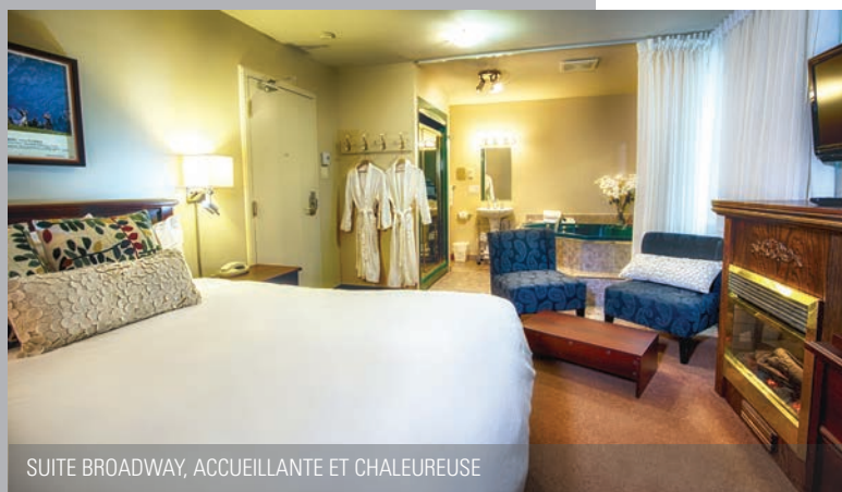
SUITE BROADWAY, ACCUEILLANTE ET CHALEUREUSE