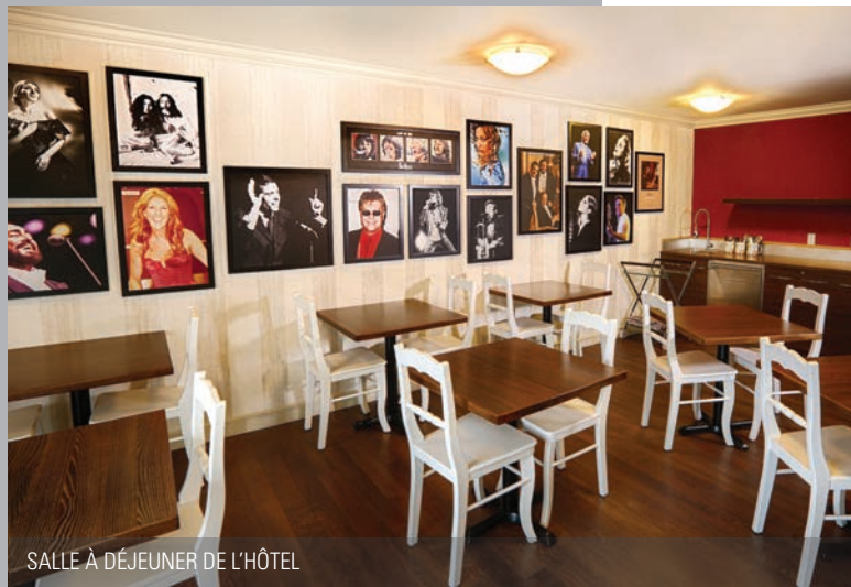
SALLE À DÉJEUNER DE L'HÔTEL